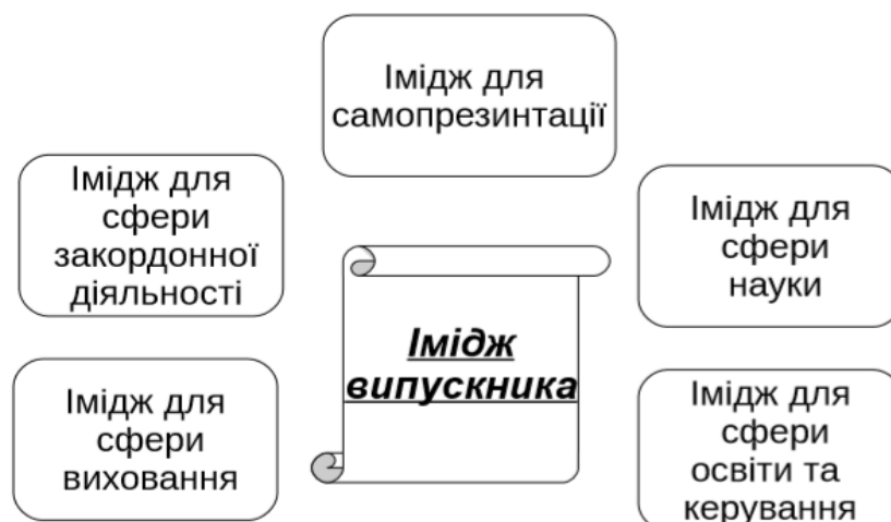
Рисунок 1 – Схема компонентів іміджу випускника

Залежно від того, які групи споживачів освітніх послуг визначають або оцінюють образ випускника, сприйняття значущих компонент іміджу може бути істотно індивідуально (рис. 1).