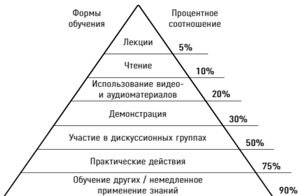
Рисунок 1 – «Пирамида обучения»

В 1980-х годах в США были проведены исследования, которые помогли обобщить данные относительно эффективности различных методик обучения взрослых (средний процент усвоения знаний). Эти результаты представлены на рисунке 1 и подтверждают древнюю китайскую мудрость: «Скажи мне, и я забуду. Покажи мне, и я запомню. Позволь мне сделать, и это станет моим навсегда».