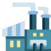
Landscape of European Industry