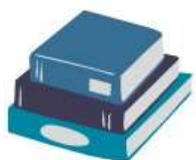
Case study Workbook

NEW DIGITAL SKILLS AND TOOLS FOR ENTREPRENEURSHIP STUDIES