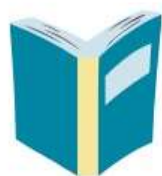
Book on entrepreneurship in Industry 5.0