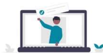
Skills Retention Service