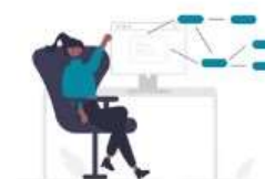
Manual on organising international seminars