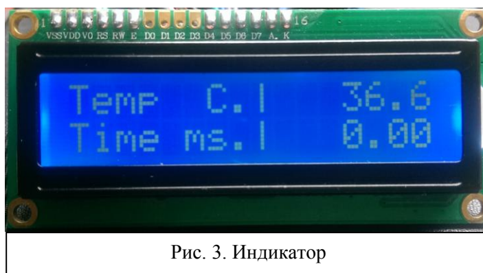
Рис. 3. Индикатор